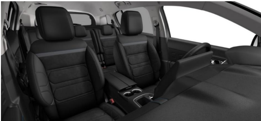
Tapiterie mixta Urban Black (0JFD)