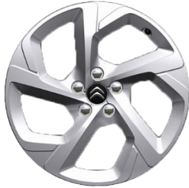
Jante aliaj 18" SWIRL (Gris Eclat Brillant) (225/55 R18) (ZHC7)