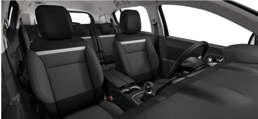
Tapiterie textila Silica Grey (51FR)