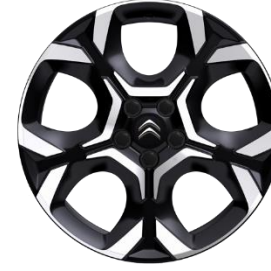
Jante aliaj diamantate 18" PULSAR (225/55 R18) (ZHXI)