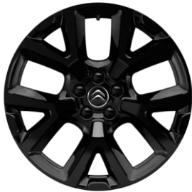
Jante aliaj Full Black 19" ART (Tall & Narrow) (205/55 R19) (ZHNY)