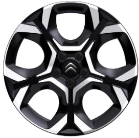
Jante aliaj diamantate 18" PULSAR (225/55 R18) (ZHXI)