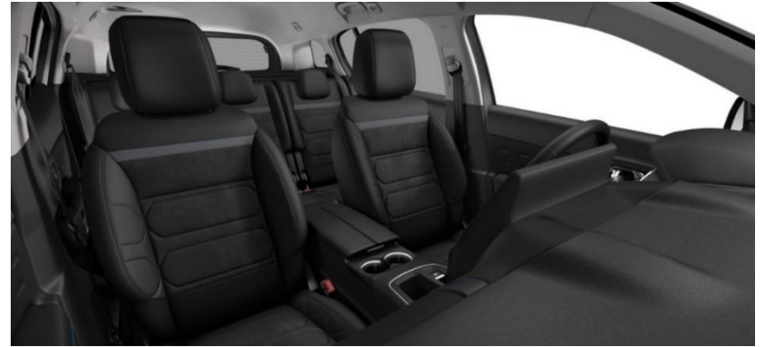
Tapiterie mixta Urban Black (0JFD)