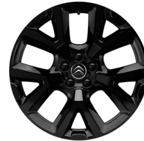
Jante aliaj Full Black 19" ART (Tall & Narrow) (205/55 R19) (ZHY9)