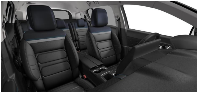
Tapiterie piele Hype Black (U0FO)