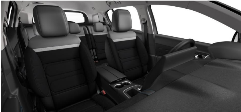
Tapiterie mixta Wild Black (V4FC)