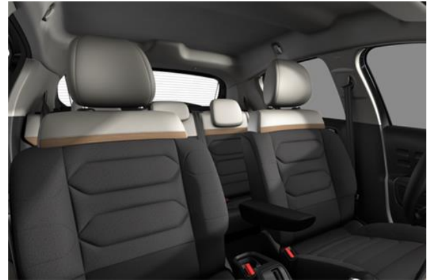
Tapiterie mixta material textil / TEP Techwood (V0FC)