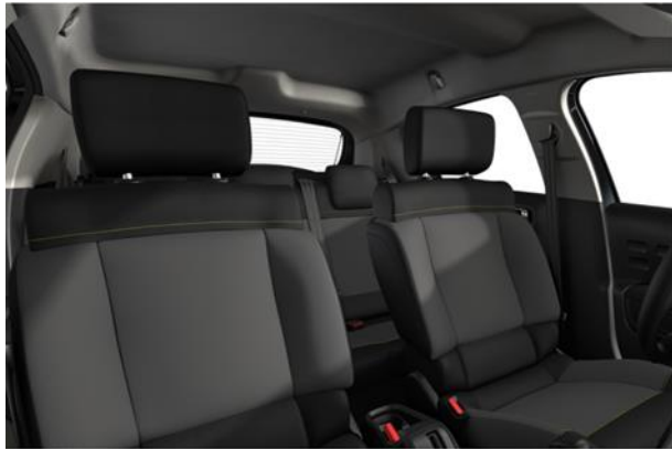
Tapiterie textila Mica Grey (23FR)