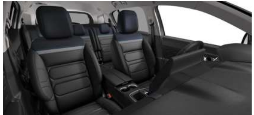
Tapiterie piele Hype Black (U0FO)