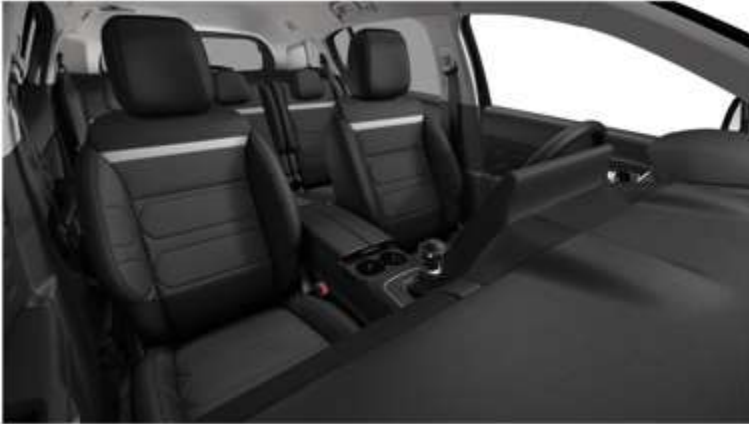
Tapiterie mixta Metropolitan Black (XCAB)