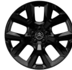
Jante aliaj Full Black 19" ART (Tall & Narrow) (205/55 R19) (ZHY9)