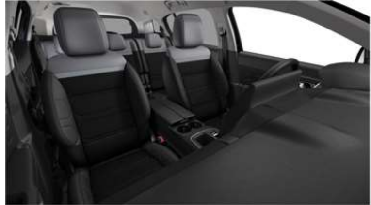
Tapiterie mixta Metropolitan Grey (FNFA)