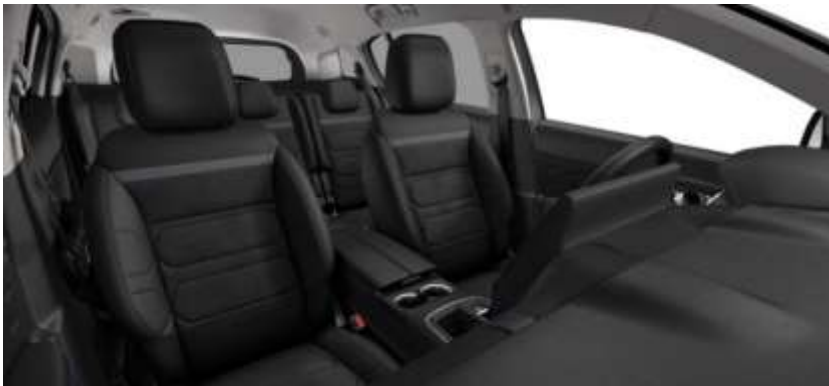
Tapiterie mixta Urban Black (0JFD)