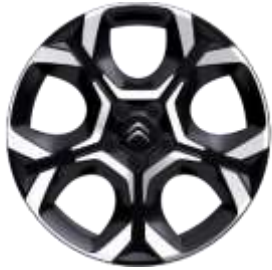
Jante aliaj diamantate 18" PULSAR (225/55 R18) (ZHXI)